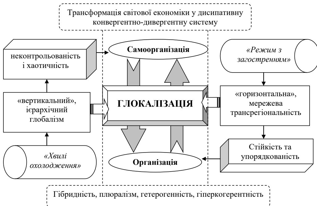
Рис. 1. Глокалізація як симбіоз ознак глобального й локального у світовій економіці як дисипативній конвергентно-дивергентній системі

О.М. Олійник трактує глокалізацію як «процес реакції різноманітних сфер людського буття на локальному рівні на світову глобалізацію, що є результатом синтезу процесів глобалізації і регіоналізації» [8, с. 50]. Причому, важливе значення